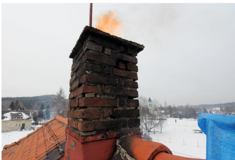
Vyhorenie sadzí v komíne